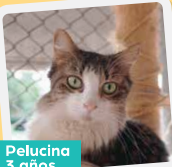
Delucina 3 años