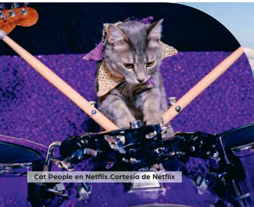
Cat People en Netflix.

La película es una oda al fuerte vínculo que los humanos establecemos con los animales de compañía, sobre todo cuando se trata de mascotas que han sido abandonadas, y a quienes la vida les da una segunda oportunidad a partir de la adopción.