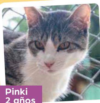
Pinki 2 años