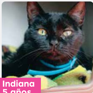
Indiana 5 años