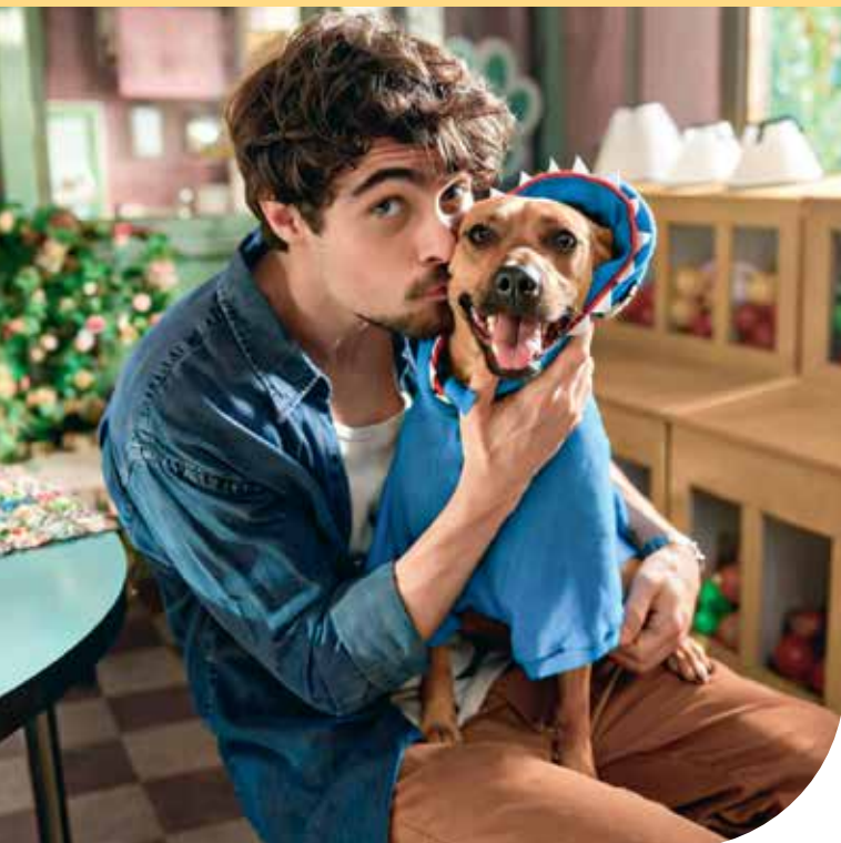
Caramelo en Netflix.