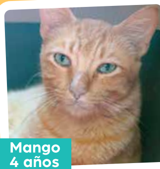
Mango 4 años