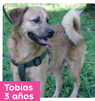
Tobías 3 años