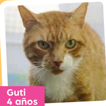
Guti 4 años