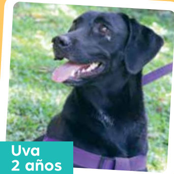
Uva 2 años