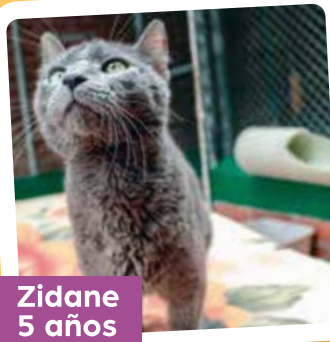
Zidane 5 años

Carrera 112 # 12 - 01, Belén Altavista. Horarios: De lunes a viernes 7:00 am a 3:00 pm. Sáb - dom y festivos: de 8:00 am a 2:00 pm.