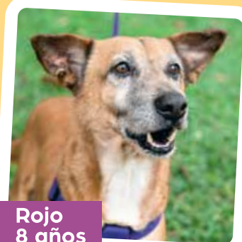
Rojo 8 años