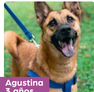
Agustina 3 años